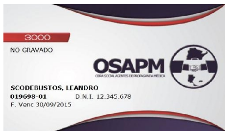
PLAN 3000 NO GRAVADO