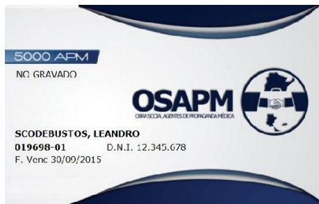
PLAN 5000 APM