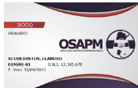
PLAN 3000 GRAVADO